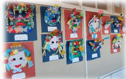
2年生 図工「お面をつくらう」