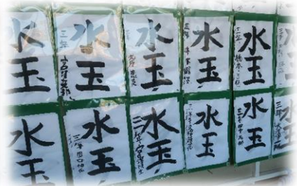
3年生の習字 (文責：教頭 山田綾子)