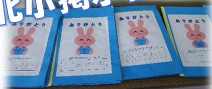
1年生 学級の友だちから「ありがとう」