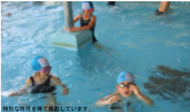
特別な許可を得て撮影しています

今年度も2つの学年ずつ清流苑に行って水泳学習を行っています。全8回実施予定です。