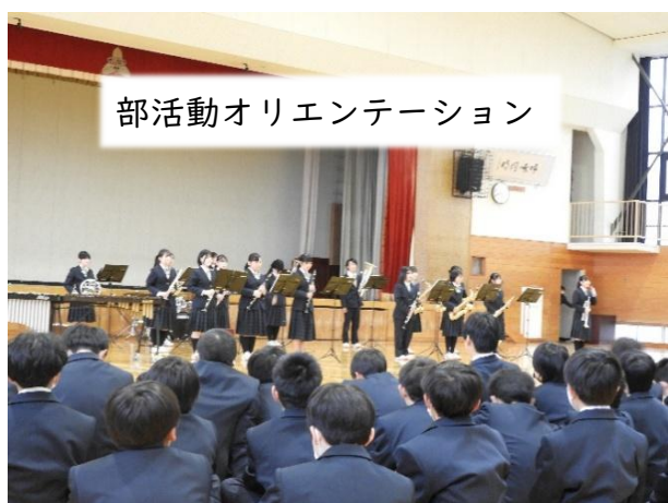
部活動オリエンテーション