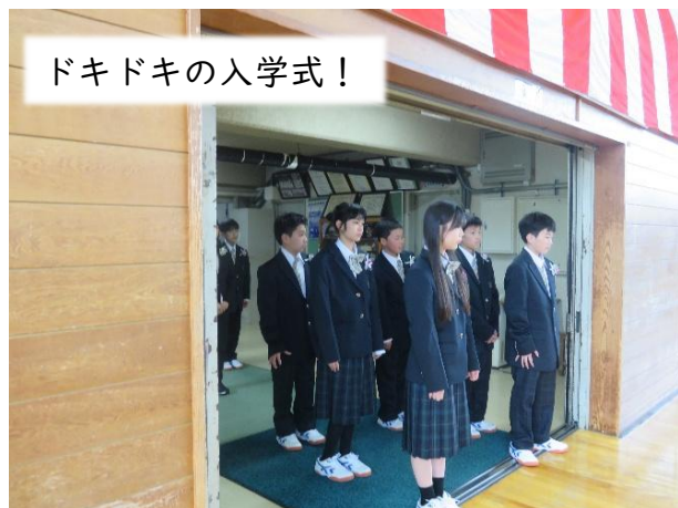
ドキドキの入学式！