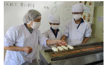
調理実習 五平餅づくり

その他, 多数の学校教育活動が, 地域の方々, 町教育委員会のご支援・ご協力により, 推進できていることに感謝している。